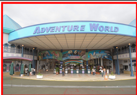
アドベンチャーワールド (イメージ)