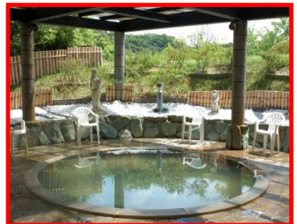
天然温泉 (イメージ)