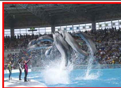
イルカショー (イメージ)