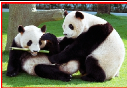
パンダファミリー (イメージ)