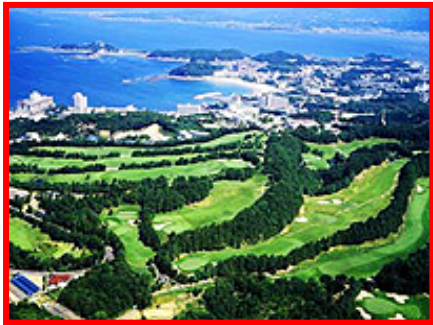
南紀白浜ゴルフ倶楽部 (イメージ)