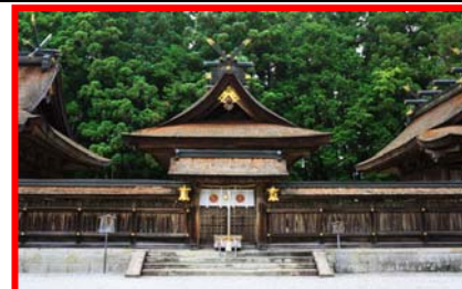
熊野本宮大社（イメージ）